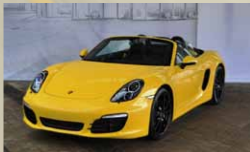
Porsche Boxster S EUR 71.888,00

Weiß, Lederausstattung schwarz, 257 kW/350 PS, PDK-Getriebe, 20 Zoll Carrera S Rad, PASM