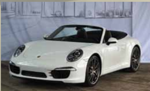
Porsche 911 Carrera Cabriolet EUR 109.900,00