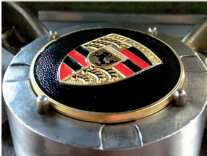
Wölben des zuvor farbig ausgelegten Porsche Wappens.