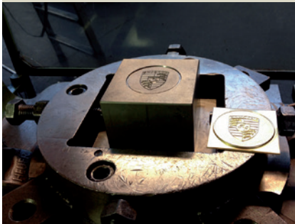
Prägwerkzeug zur Prägung in die Platine.