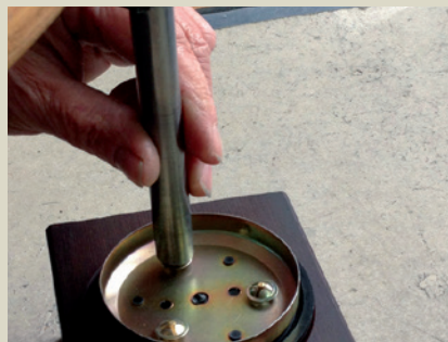
Zusammenbau der Einzelteile durch Anbringen der Federmuttern.

Porsche Classic legt den Radzierdeckel aus dem „Porsche Sonderwunschprogramm“ der 80er Jahre neu auf und lässt damit Liebhaberherzen höher schlagen.