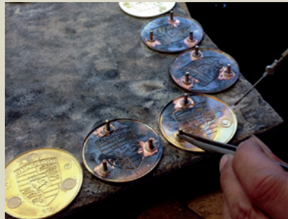
Hartlöten der Stifte nach Ausstanzen der Platine.