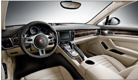
Das Interieur: bietet hohen Komfort und ein sportlich-exklusives Ambiente.