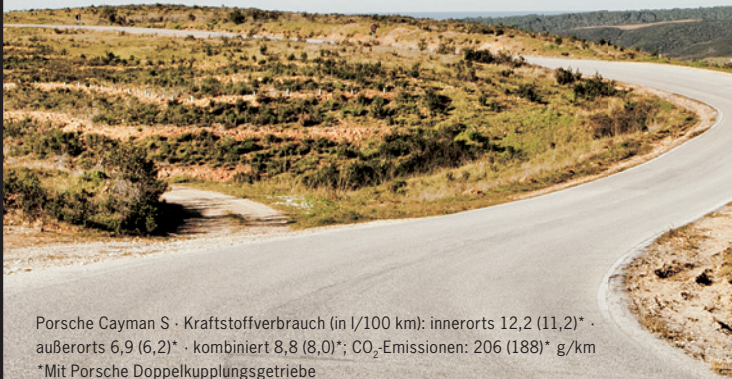
Porsche Cayman S · Kraftstoffverbrauch (in l/100 km): innerorts 12,2 (11,2)* · außerorts 6,9 (6,2)* · kombiniert 8,8 (8,0)*; CO 2 -Emissionen: 206 (188)* g/km *Mit Porsche Doppelkupplungsgetriebe

Die maßgeschneiderten Leasingangebote und attraktiven Konditionen der Porsche Financial Services GmbH machen den konsequenten Kurvenenuss im Handumdrehen erreichbar. Besuchen Sie uns im Porsche Zentrum Altötting und überzeugen Sie sich von der unverwechselbaren Dynamik und Sportlichkeit unserer Mittelmotor-Modellpalette. Denn wer sich schon im Winter mit seinen Sehnsüchten beschäftigt, der kann beim ersten Sonnenstrahl im Frühling seinem Bewegungsdrang freien Lauf lassen. Ganz gleich, ob im geschlossenen Cayman oder mit Wind in den Haaren im offenen Boxster: Vor jeder Kurve werden Sie die Vorfriede spüren. Und hinter jeder Kurve einen neuen Weg zum Glück finden.