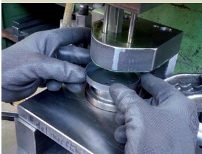
Lochen und Stempeln des Halters.