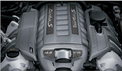
Die Turbolader: in Parallelschaltung angelegt und mit größeren Verdichtern ausgestattet.