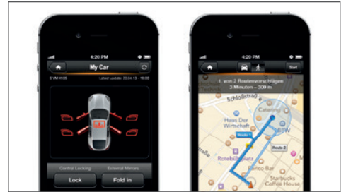
Porsche Car Connect: externe Steuerung bestimmter Funktionen via Smartphone.

Was ist Kraft? In erster Linie eine physikalische Größe. Per Definition: Masse mal Beschleunigung. Bei Porsche reicht die Kombination aus einem Wort und einem Buchstaben aus, um Höchstleistungen zu definieren und dem Begriff Kraft eine Bedeutung zu geben: Turbo S.