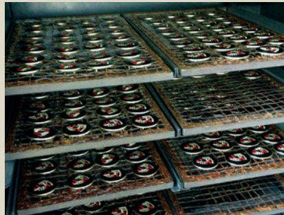
Einbrennen des Wappens.