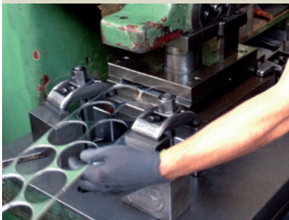
Stanzen der Platine.